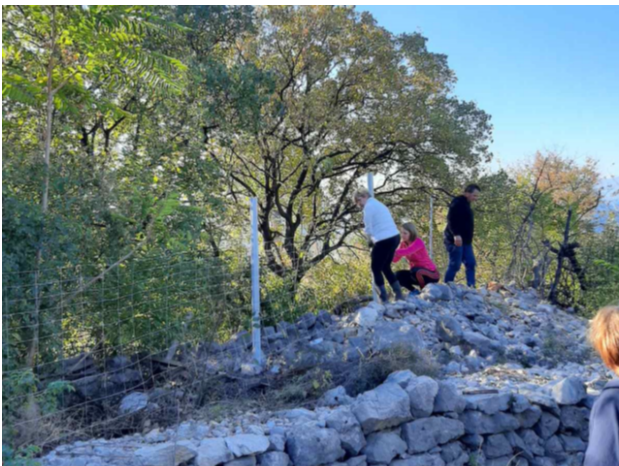
Slika 3. Postavljanje ograde na jugoistočnom dijelu vrta