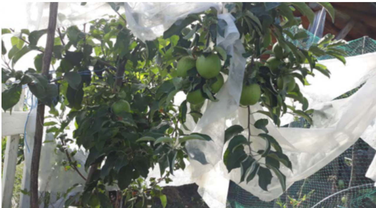
Slika 4. Ekološka stupasta jabuka

Osim srna, problem su predstavljale i ptice koje su također uništavale urod. U priloženoj slici je jedan od primjera kako se agrotekstilom i sitnom mrežom zaštitila jabuka na način da ptice ne dolaze, a jabuka ipak ima dovoljno sunčeve svjetlosti.