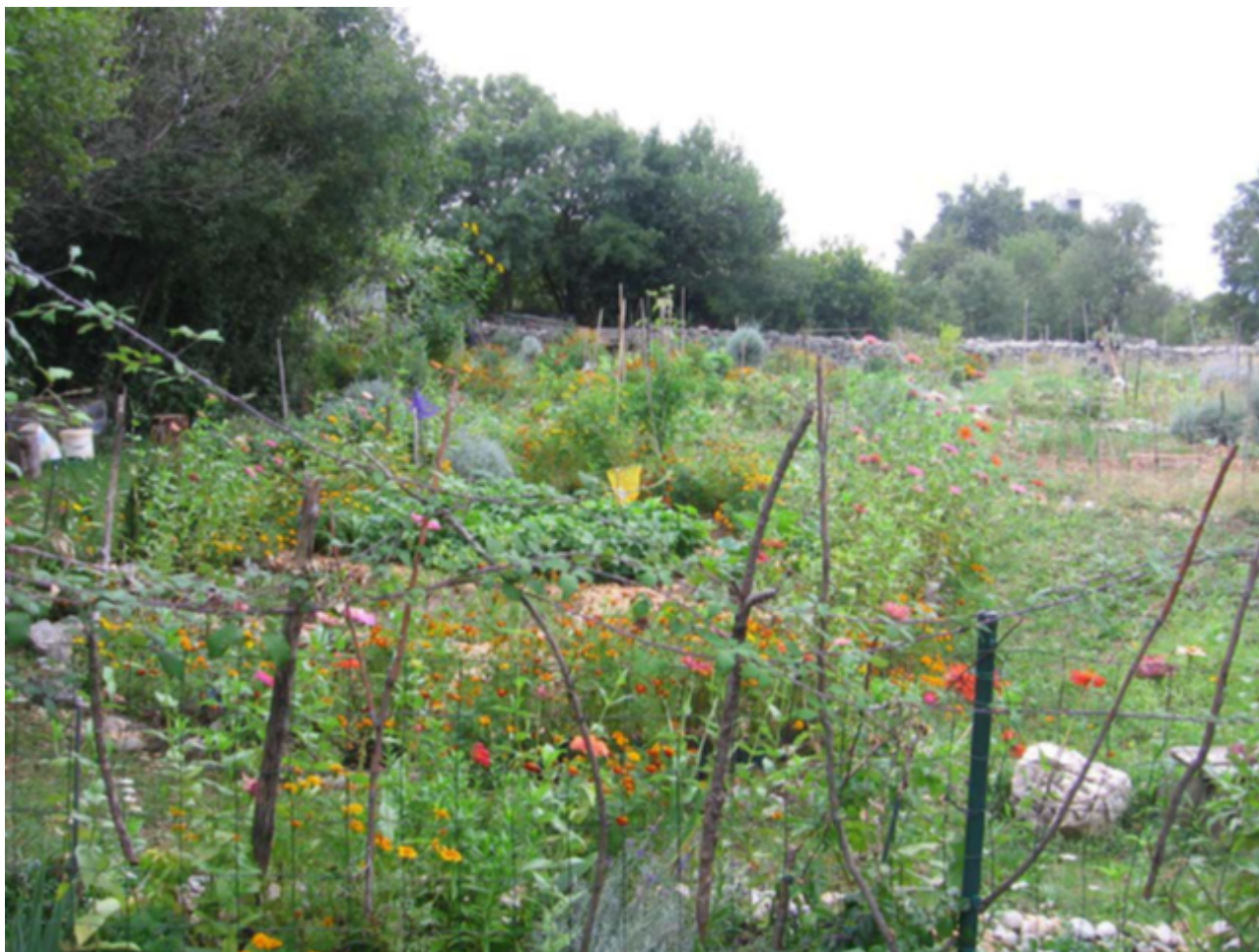
Slika 1. Pokušaj pojačavanja ograde kupinama i granjem

U 2021. godini, poseban je problem predstavljalo ulaženje srna i uništavanje uroda. Do početka ljeta srne su uništile sav urod. Jedino rješenje bilo je ograđivanje vrta visokom ogradom. Posao podizanja ograde obavljen je u 3 radne akcije. U listopadu 2021. obavljena je zadnja faza s najvećim dijelom radova.