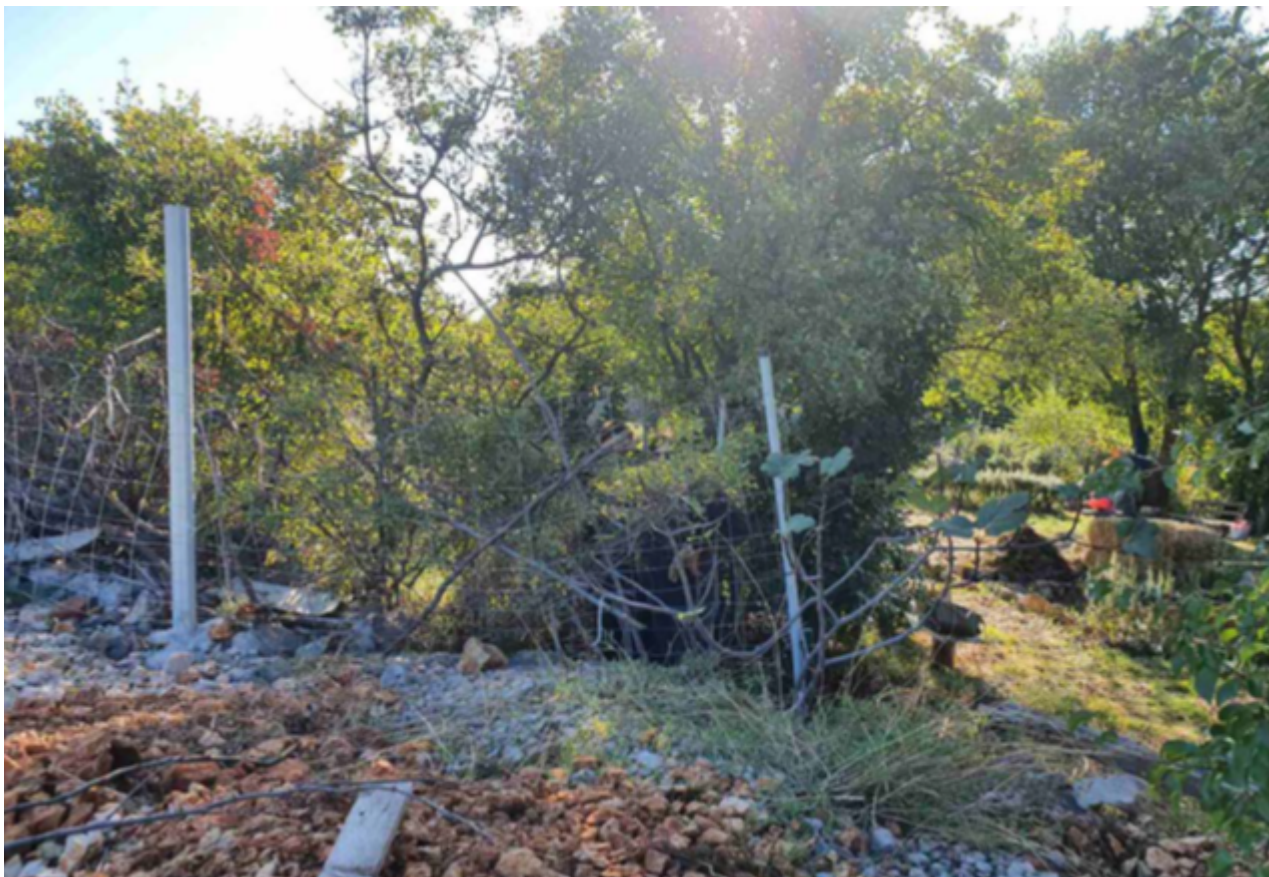
Slika 2. Podizanje ograde na istočnom dijelu vrta