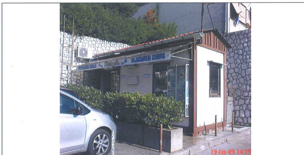
fotografija prikazuje stanje lokacije za postavu privremenog objekta iz jeseni 2009. godine