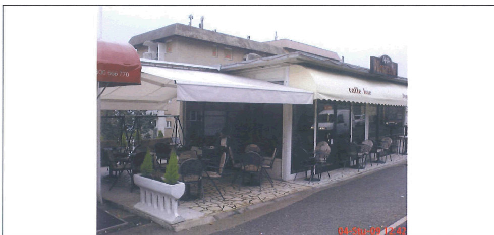
fotografija prikazuje stanje lokacije za postavu privremenog objekta iz jeseni 2009. godine