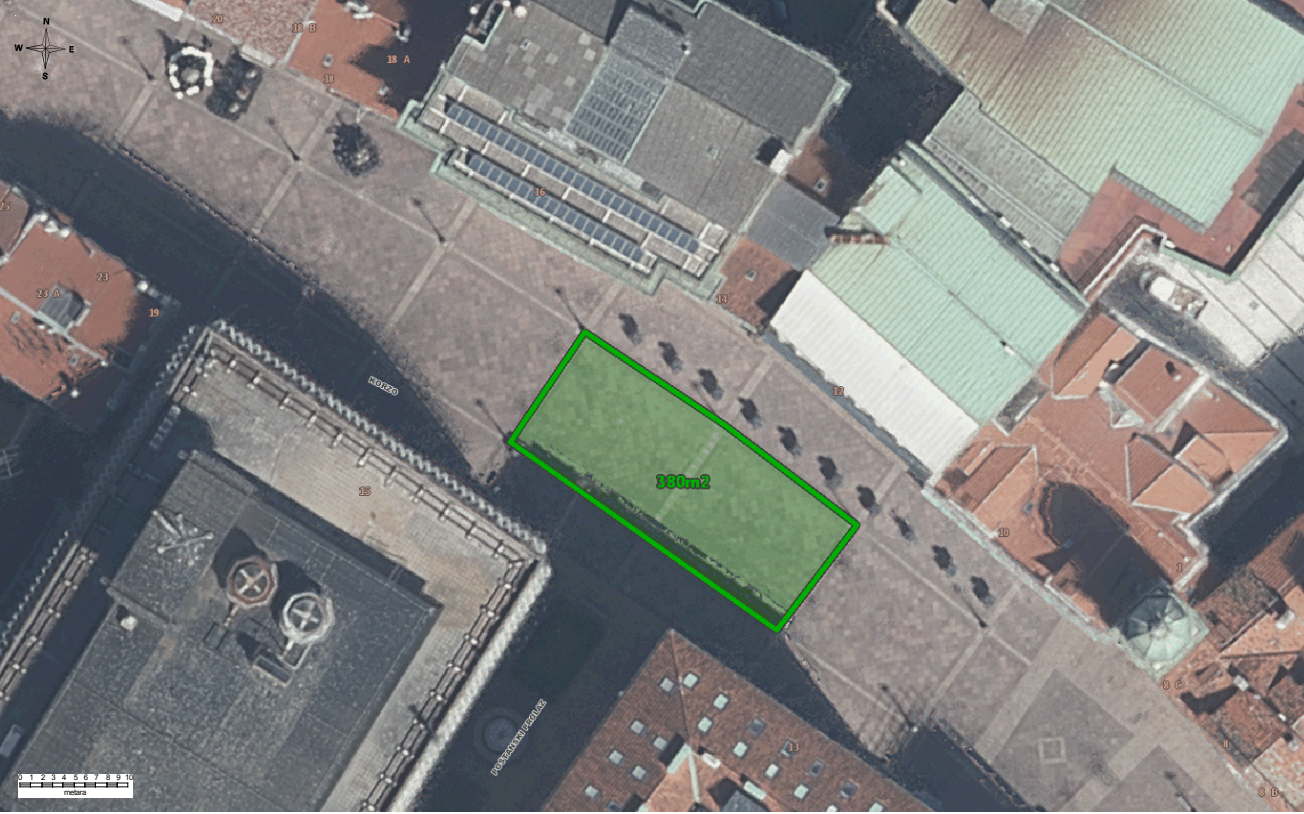
Privitak 1. Grafički prikaz poligona za električne romobile 19.09.2022.godine te romobile i skateboarde 22.09. 2022. godine