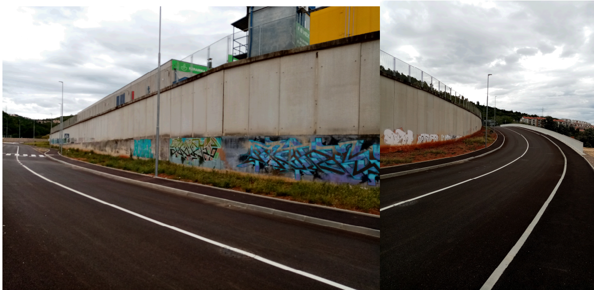
Slike 1. i 2. Lokacije sadnje stabala vrste Melia na području Bodulova