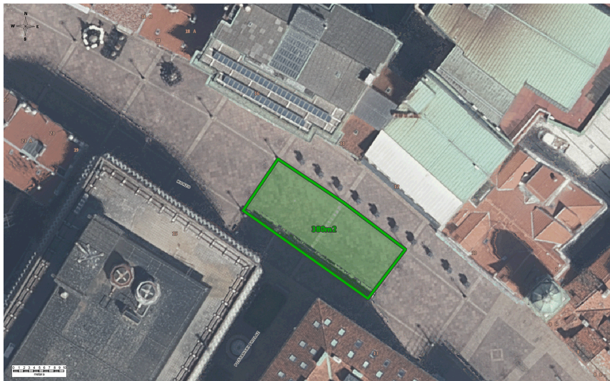
Privatak 1. Grafički prikaz poligona za električne romobile 19.09.2022.godine te romobile i skateboarde 22.09. 2022. godine