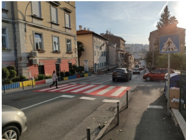
Povećanje vidljivosti pješačkog prijelaza u Vukovarskoj ulici kod kućnog broja 12 izveden u crvenoj termoplastici

Pritom se posebno ističe označavanje brojnih pješačkih prijelaza i oznaka na kolniku tzv. termoplastikom u crvenoj boji, a kako bi se povećala sigurnost pješaka u prometu. Nekoliko primjera nalazi se na fotografijama u nastavku. Termoplastika je zbog svojih izrazito dobrih karakteristika postala neizostavan dio i najčešće korišten materijal za označavanje oznaka na kolniku diljem Europe kroz protekla tri desetljeća, pa tako i u Rijeci. Takvi materijali su prilikom primjene manje osjetljivi na vanjsku temperaturu i temperaturu kolnika, a oznake izrađene od ovog materijala karakterizira vrlo dobra uočljivost u svim vremenskim prilikama, kao i u noćnim i drugim uvjetima smanjene vidljivosti, što je posebno važno za sigurnost pješaka. I u ovoj godini TD Rijeka plus d.o.o. će u suradnji s mjesnim odborima nastaviti raditi na povećanju i realizaciji stupnja sigurnosti u prometu, a kako bi se prometna kultura dovela na visoku razinu, i na taj način zaštitili svi sudionici u prometu.