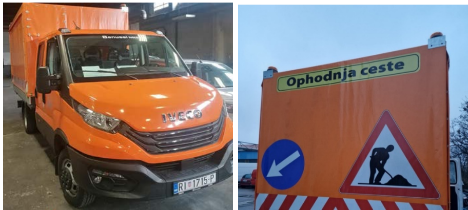
Novo polivalentno ophodarsko vozilo

preuzelo je novo specijalno ophodarsko vozilo vrijedno 300,000 kn/39.816,84 EUR koje će ophodarskoj službi omogućiti efikasniji nadzor i ophodnju prometnica te učinkovitiju provedbu mjera za zaštitu i osiguranje cesta.