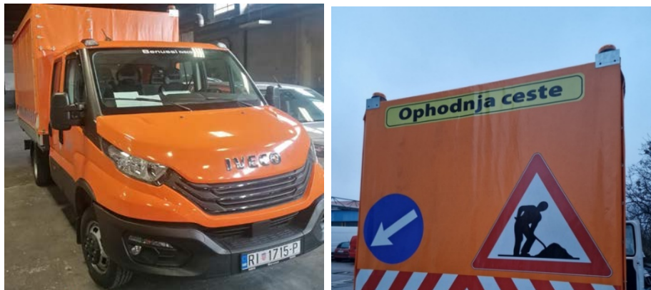
Novo polivalentno ophodarsko vozilo

preuzelo je novo specijalno ophodarsko vozilo vrijedno 300,000 kn/39.816,84 EUR koje će ophodarskoj službi omogućiti efikasniji nadzor i ophodnju prometnica te učinkovitiju provedbu mjera za zaštitu i osiguranje cesta.