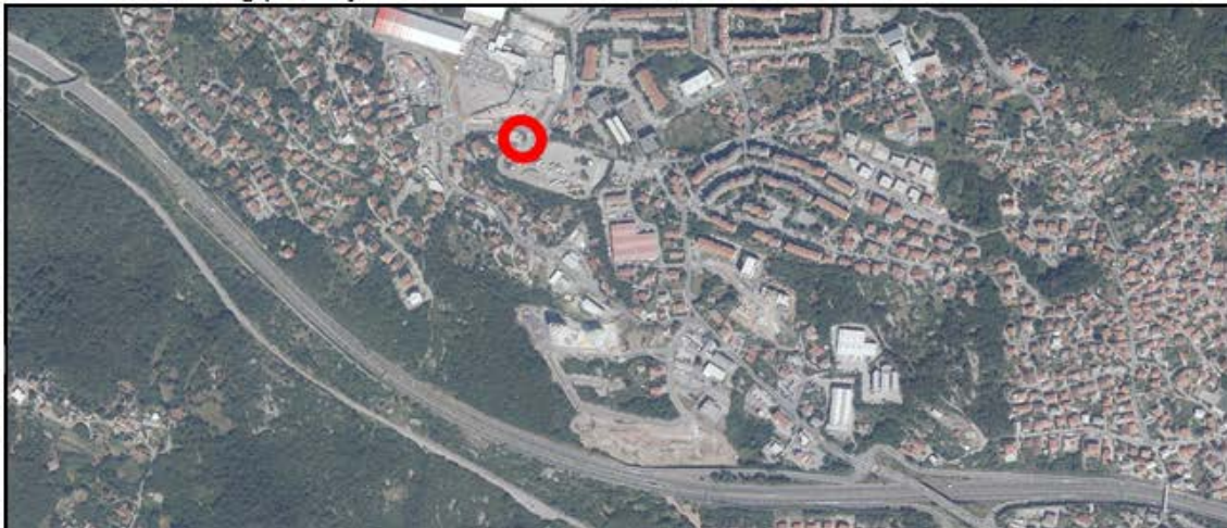
Kopija katastarskog plana