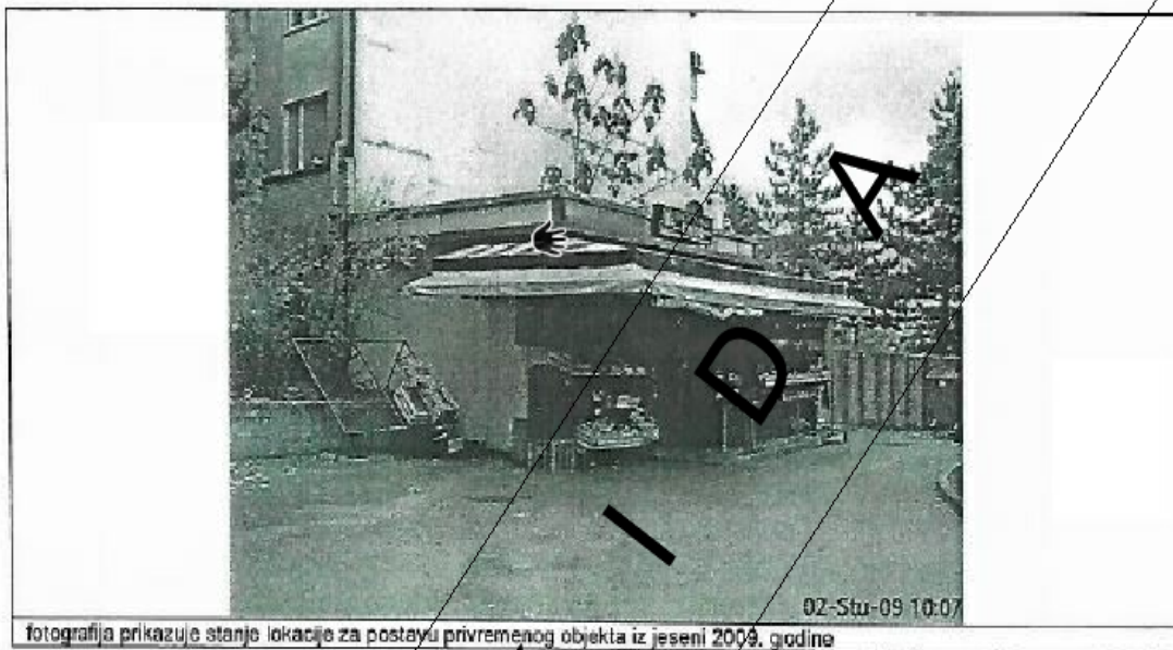
fotografija prikazuje stanje lokacije za postavu privremenog objekta iz jeseni 2009. godine