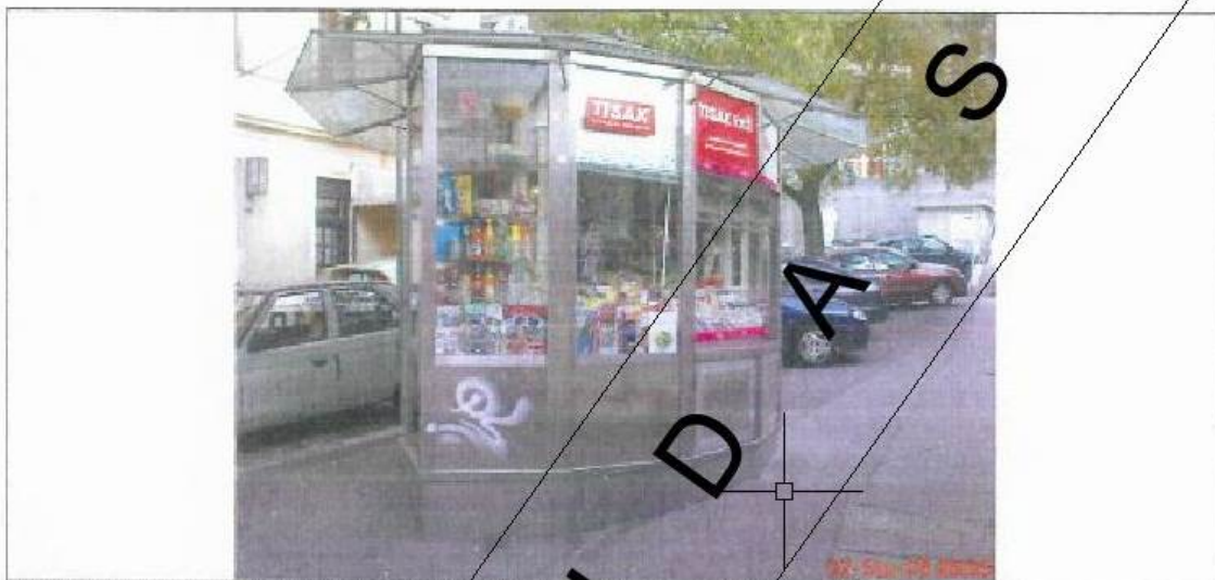
fotografija prikazuje stanje lokacije za postavu privremenog objekta iz jeseni 2009. godine