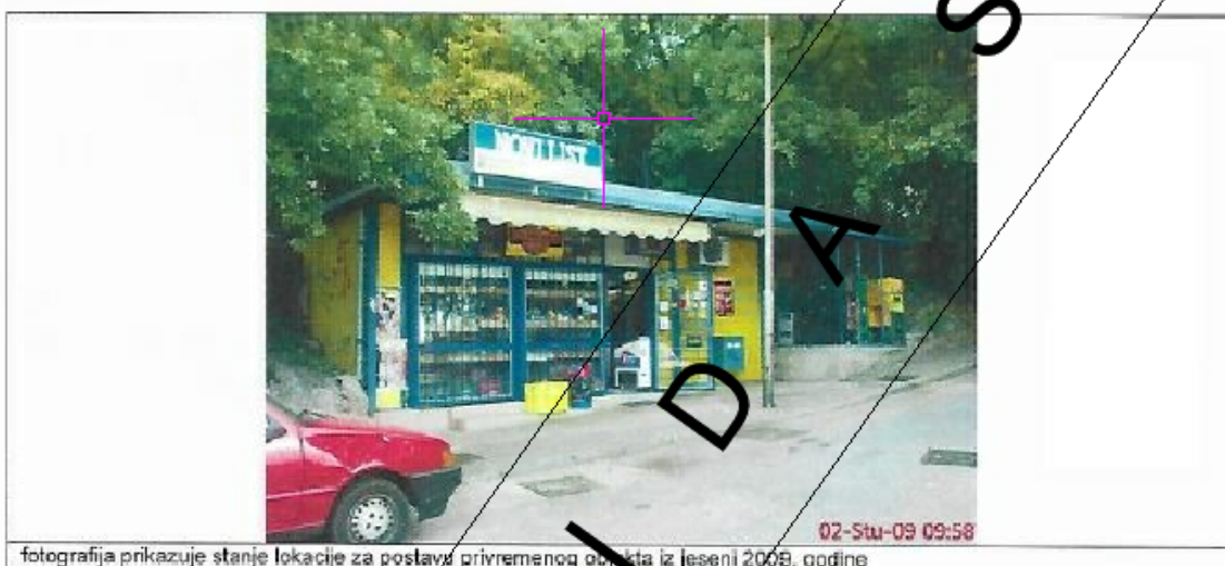
fotografija prikazuje stanje lokacije za postavu privremenog objekta iz jeseni 2008. godine