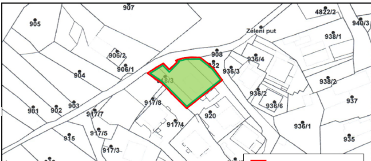
Kopija gruntovnog plana