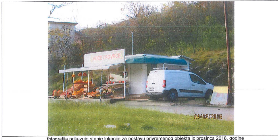
fotografija prikazuje stanje lokacije za postavu privremenog objekta iz prosinca 2018. godine