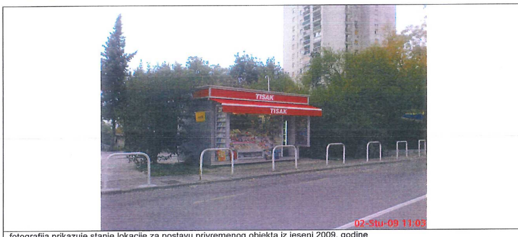
fotografija prikazuje stanje lokacije za postavu privremenog objekta iz jeseni 2009. godine