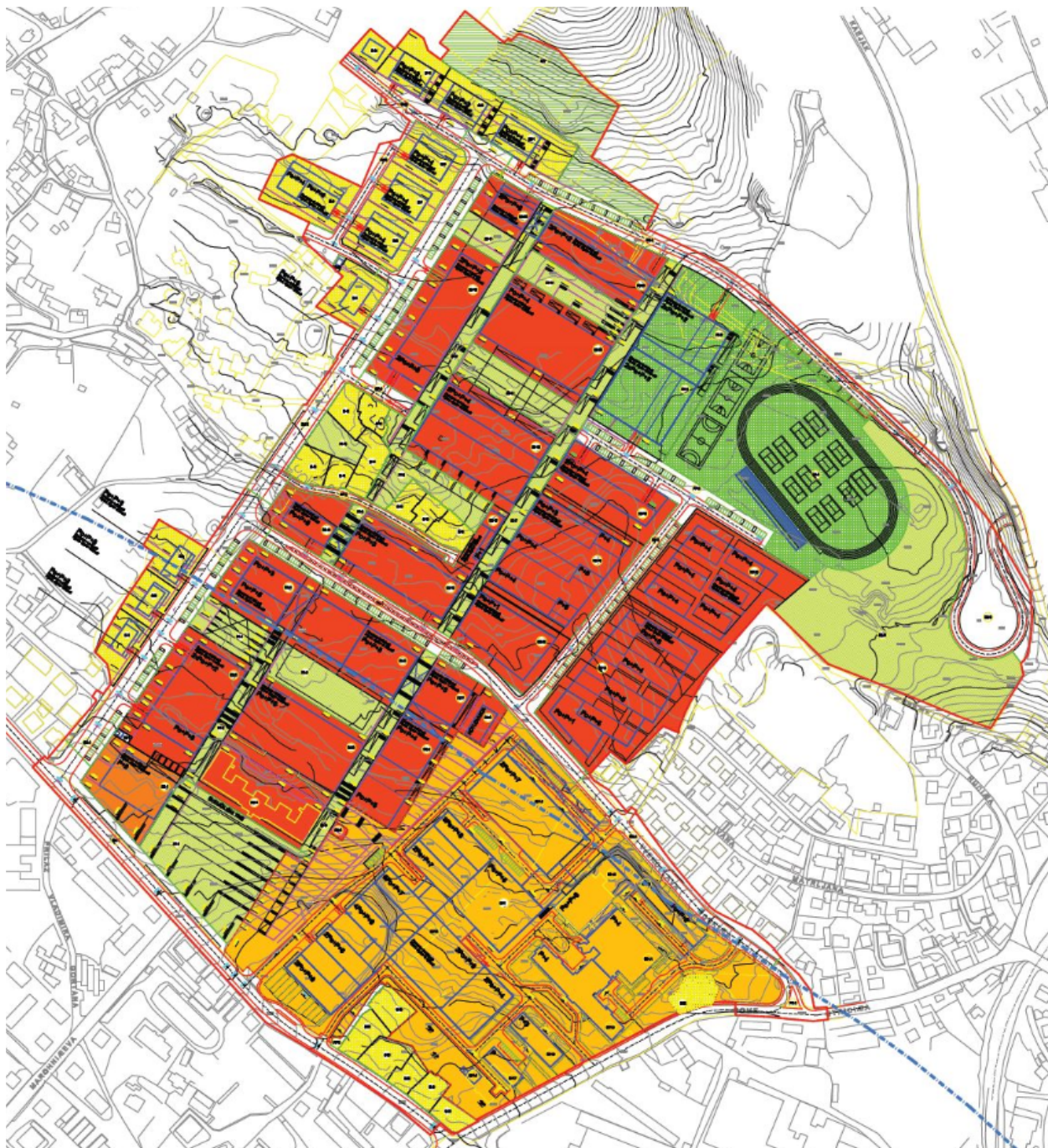
SLIKA 2. Izvod iz Detaljnog plana uređenja područja Sveučilišnog kampusa i KBC-a - kartografski prikaz broj 1. Detaljna namjena površina