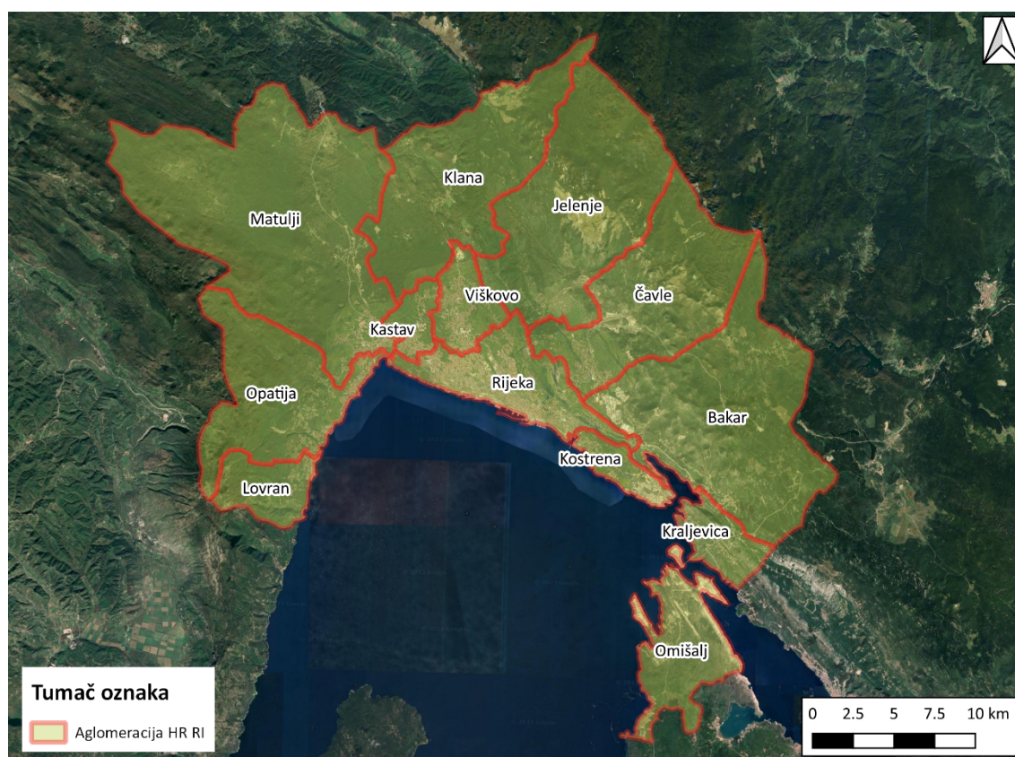
Grafički prikaz Error! No text of specified style in document.-1: Područje aglomeracije Rijeka te grada Rijeke

Prema Uredbi o određivanju zona i aglomeracija prema razinama onečišćenosti zraka na teritoriju Republike Hrvatske (NN 1/14) područje Grada Rijeke uključeno je u aglomeraciju Rijeka oznake (HR RI). U sklopu aglomeracije nalaze se još i Grad Bakar, Grad Kastav, Grad Kraljevica, Grad Opatija, Općina Viškovo, Općina Čavle, Općina Jelenje, Općina Kostrena, Općina Klana, Općina Matulji, Općina Lovran, Općina Omišalj. Na grafičkom prikazu u nastavku prikazano je područje aglomeracije HR RI.