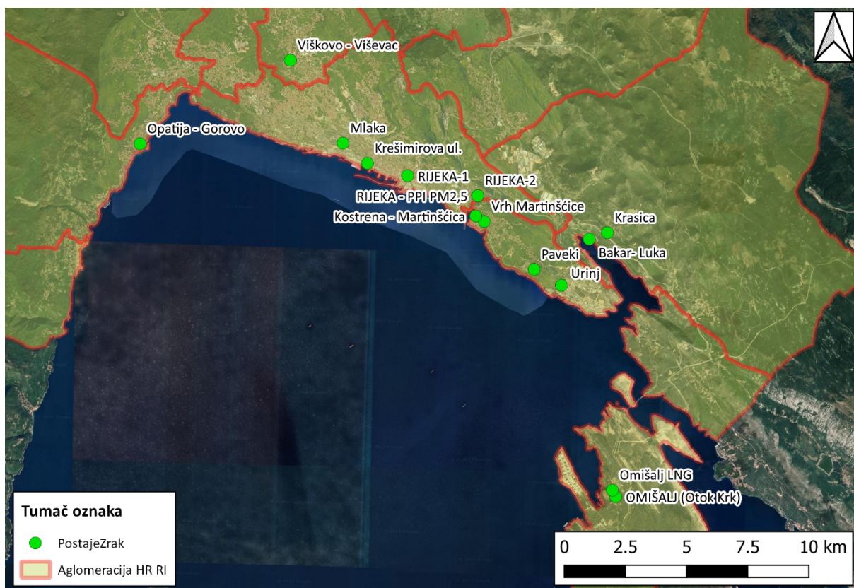
Grafički prikaz Error! No text of specified style in document.-2: Lokacije mjernih postaja za praćenje kvalitete zraka na području aglomeracije Rijeka