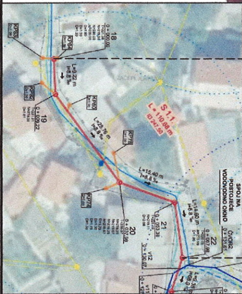
SITUACIJA - izvadak iz Izvedbenog projekta (HIDRO CONSULT d.o.o., ZOP 539/IZP, svibanj 2023.) Kolektor S1.1, od 18 do 22