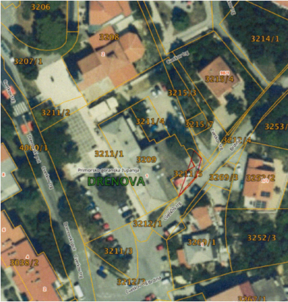
Ortofoto snimak lokacije