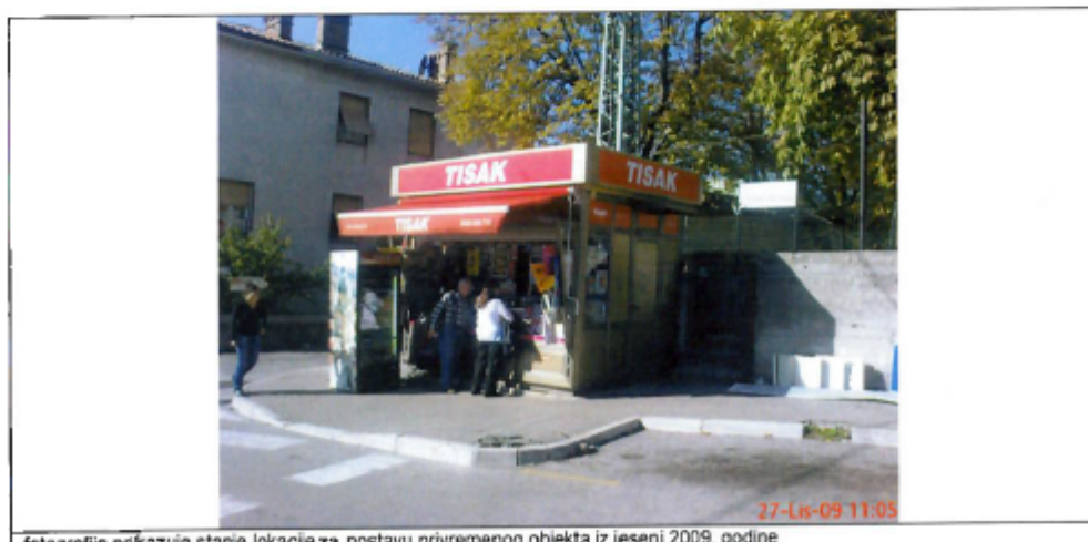
fotografija prikazuje stanje lokacije za postavu privremenog objekta iz jeseni 2009. godine