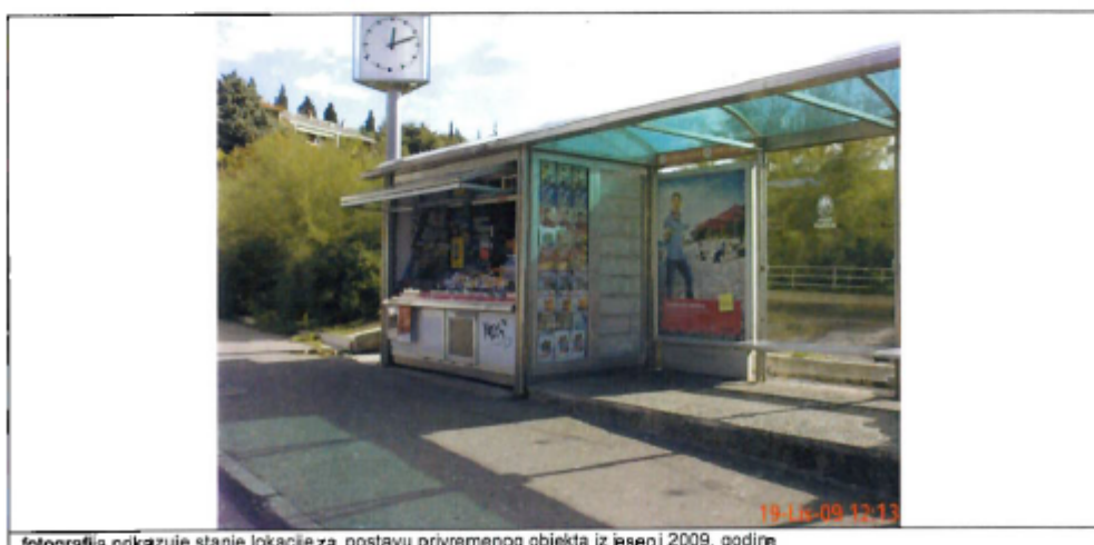
fotografija prikazuje stanje lokacije za postavu privremenog objekta iz jeseni 2009. godine