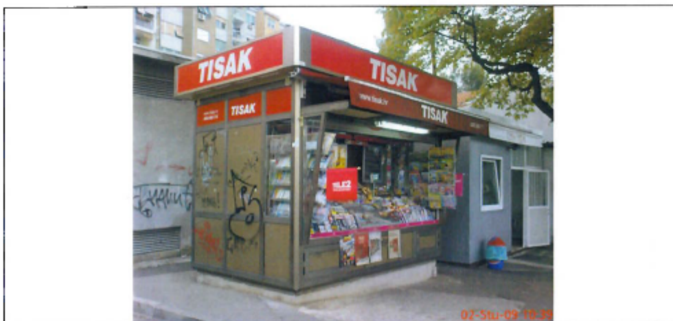
fotografija prikazuje stanje lokacije za postavu privremenog objekta iz jeseni 2009. godine