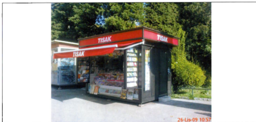
fotografija prikazuje stanje lokacije za postavu privremenog objekta iz jeseni 2009. godine