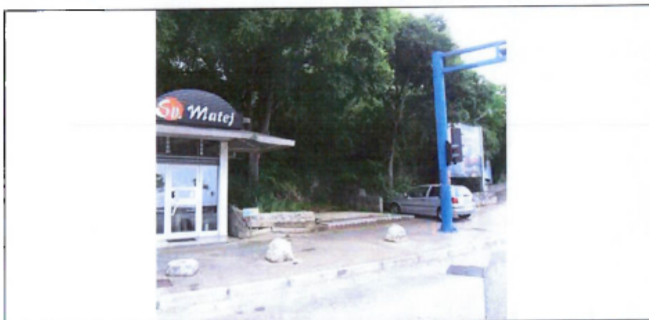
fotografija prikazuje stanje lokacije za postavu privremenog objekta iz lipnja 2019. godine