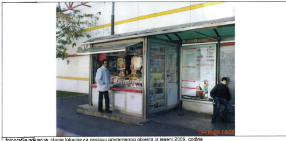
fotografija prikazuje stanje lokacije za postavu privremenog objekta iz jeseni 2009. godine